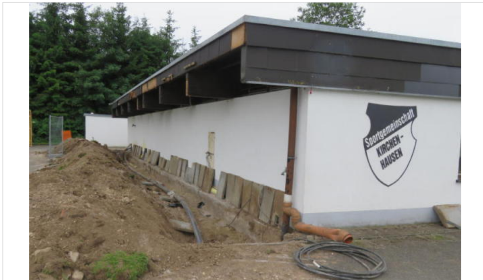
Ab dem heutigen Montag wird das Clubheim der SG Kirchen-Hausen Geschichte, das Gebäude wird in dieser Woche abgebrochen.

Abbrucharbeiten am bisherigen Domizil der Sportgemeinschaft Kirchen-Hausen beginnen in dieser Woche.